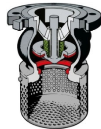
Système de fermeture 02 Image symbolique

Conformité CE directive 2014/68/EU Perçage bride suivant EN 1092-2