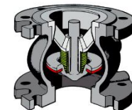
Système de fermeture 02

Conformité CE directive 2014/68/EU Perçage bride suivant EN 1092-2