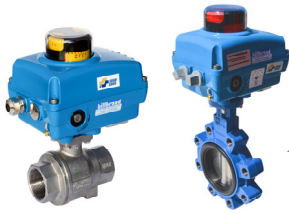
Motorkugelhahn oder Motorabsperklappe